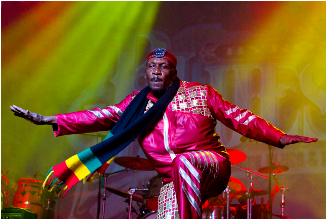
Reggae-Legende Jimmy Cliff verzaubert Glarus zum Abschluss am Samstag, 24. August 2019, auf der GLKB-Hauptbühne.