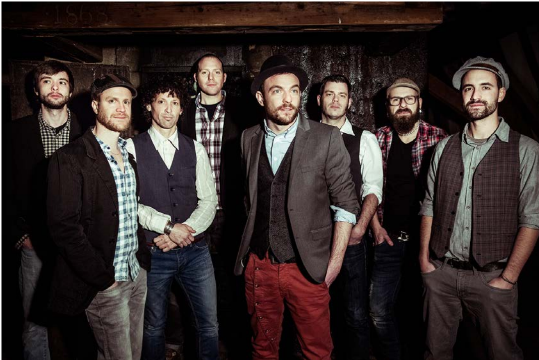
Die Berner Mundart Rap-Troubadour-Urban-Folk-Pop Band Troubas Kater spielt am Donnerstag, 22. August 2019 auf der glärnerSach-Bühne.